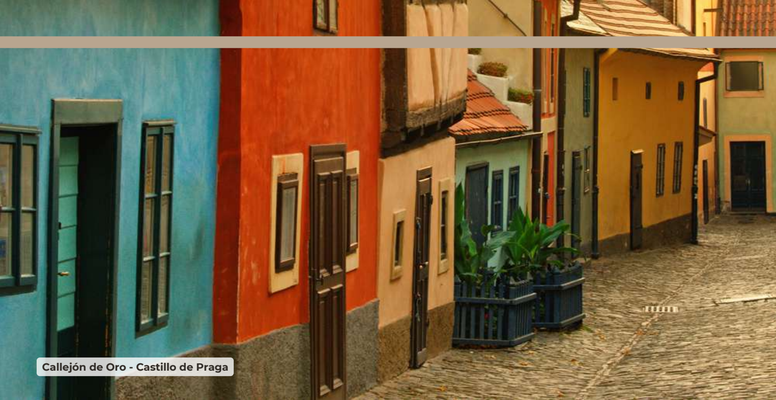
Callejón de Oro - Castillo de Praga