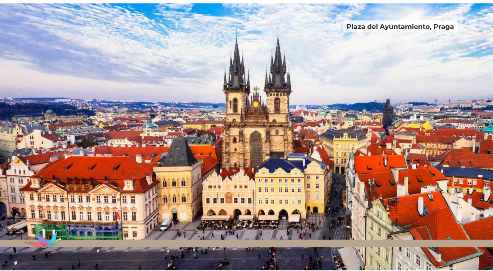
Plaza del Ayuntamiento, Praga

Desayuno Recorreremos las principales calles y monumentos del Barrio de Stare Mesto (con nuestro guía local) donde apreciaremos la majestuosidad de la Torre de la Pólvora (estilo gótico), la Casa Municipal (art nouveau), el camino real que comienza en la calle Celetna para llegar a la Plaza de la Ciudad Vieja, con la Iglesia de nuestra Señora de Thyn y el famoso reloj astronómico. A continuación, y por la Calle Karlova se llega al puente de Carlos IV, el más famoso de la ciudad. Atravesaremos el barrio judío y terminaremos la visita junto al Reloj. Almuerzo. Resto de la tarde libre. Regreso al hotel a la hora indicada. Cena y alojamiento