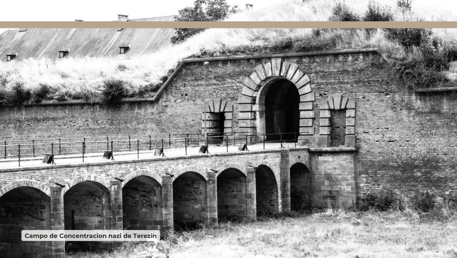
Campo de Concentraci3n nazi de Terezin